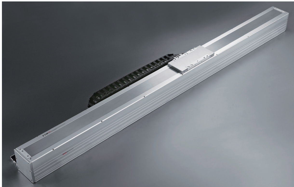
此圖僅供參考，出貨規格詳見尺寸圖面

免費服務專線：大陸 400-875-0009 台灣 0800-800-893 Toll-free Number China Taiwan